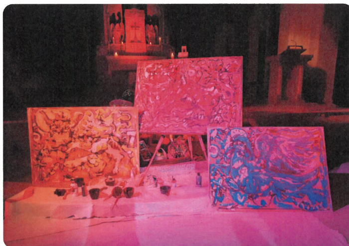
Museumsnacht Neuhausen Sept. 2021

Unsere Mitarbeiterinnen und Mitarbeiter haben grossen Einsatz im Dienste des Pastoralraums und für die Kirchgemeinde Neuhausen geleistet. Der Kirchenstand dankt allen Mitarbeitenden, Helferinnen und Helfern, Gruppierungen, Vereinen, die sich im Jahr 2021 tatkräftig engagiert und eingesetzt haben ganz herzlich. Vergelt's Gott.