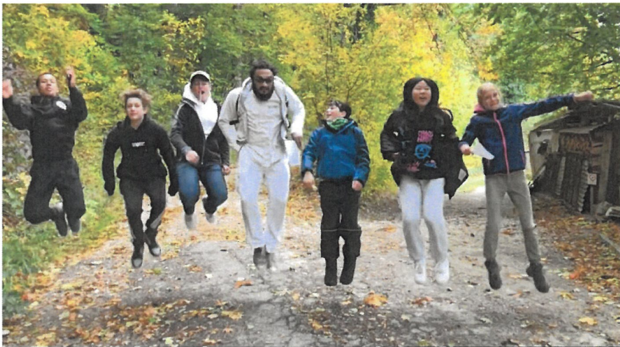
Reli-Tage in Beringen 2021 (als Ersatz für Relilager)